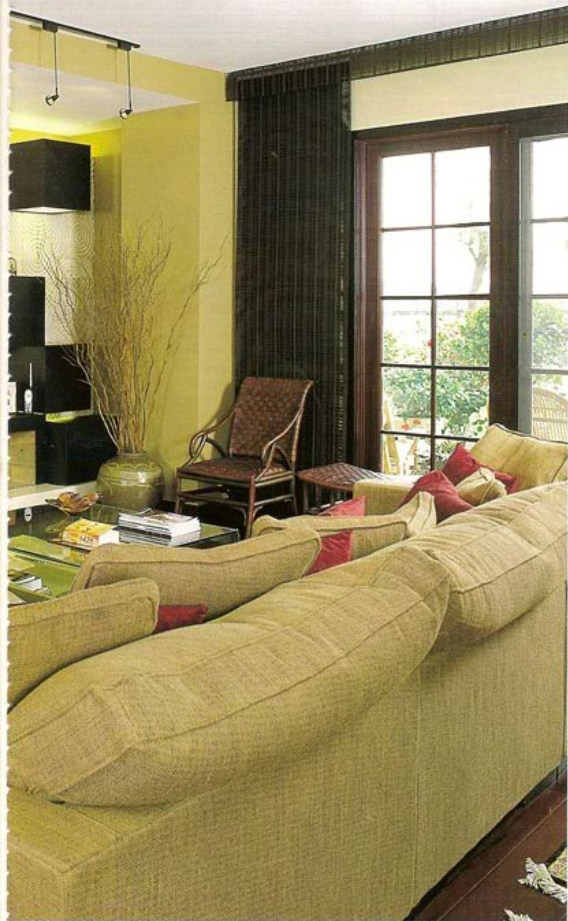
客厅色彩沉稳，一面电视墙设计得尤其独特，白色花纹墙上的黑色方块，立体感突出。