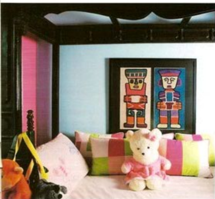
老式家具和卡通人物很好地混搭成了小女儿的闺房。

口。Bya笑着专家的结论“典型的处女座和天蝎座都十分注重财政的保障。理性的处女座也乐于跟随天蝎座时不时地冒险、尝新。”Rick在边上认真地听，还时不时点头同意，“的确，非常正确。”