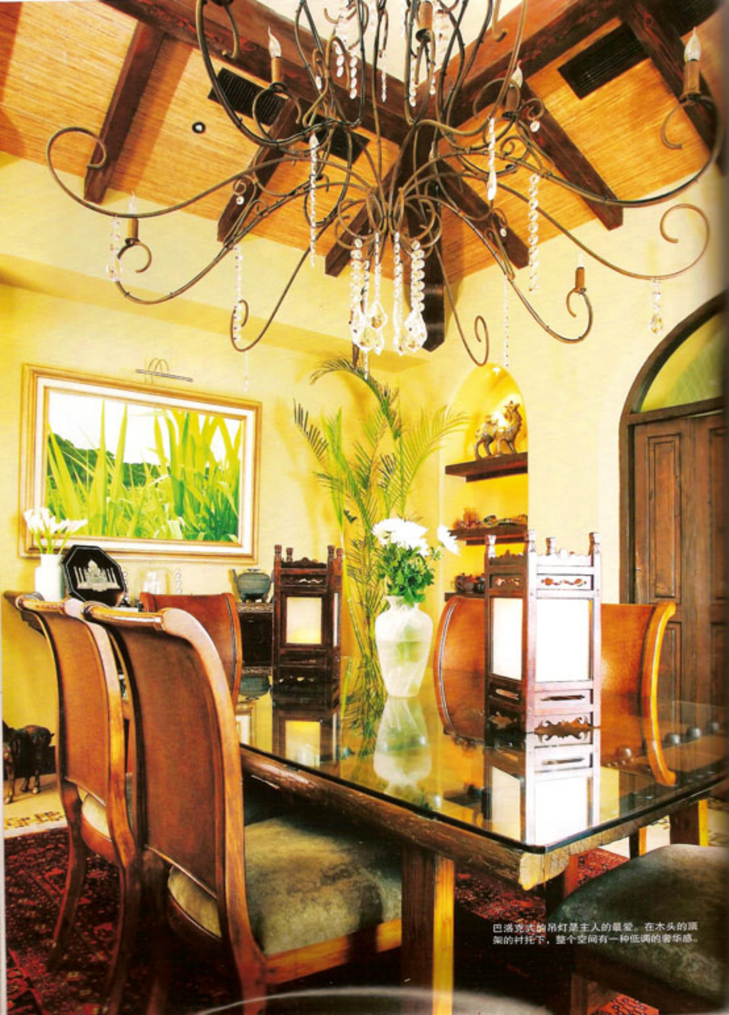
巴洛克式的吊灯是主人的最爱。在木头的顶架的衬托下，整个空间有一种低调的奢华感。