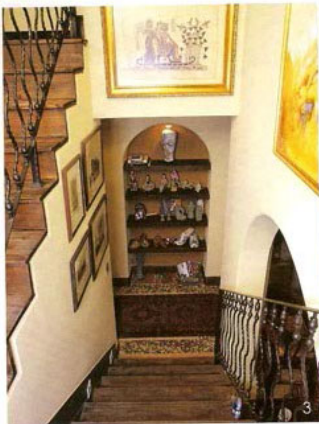
3. 楼梯正对的收藏格，不经意间透露了主人的收藏小爱好和曾经走过的回忆。这是根据孩子小时候的照片画的油画。