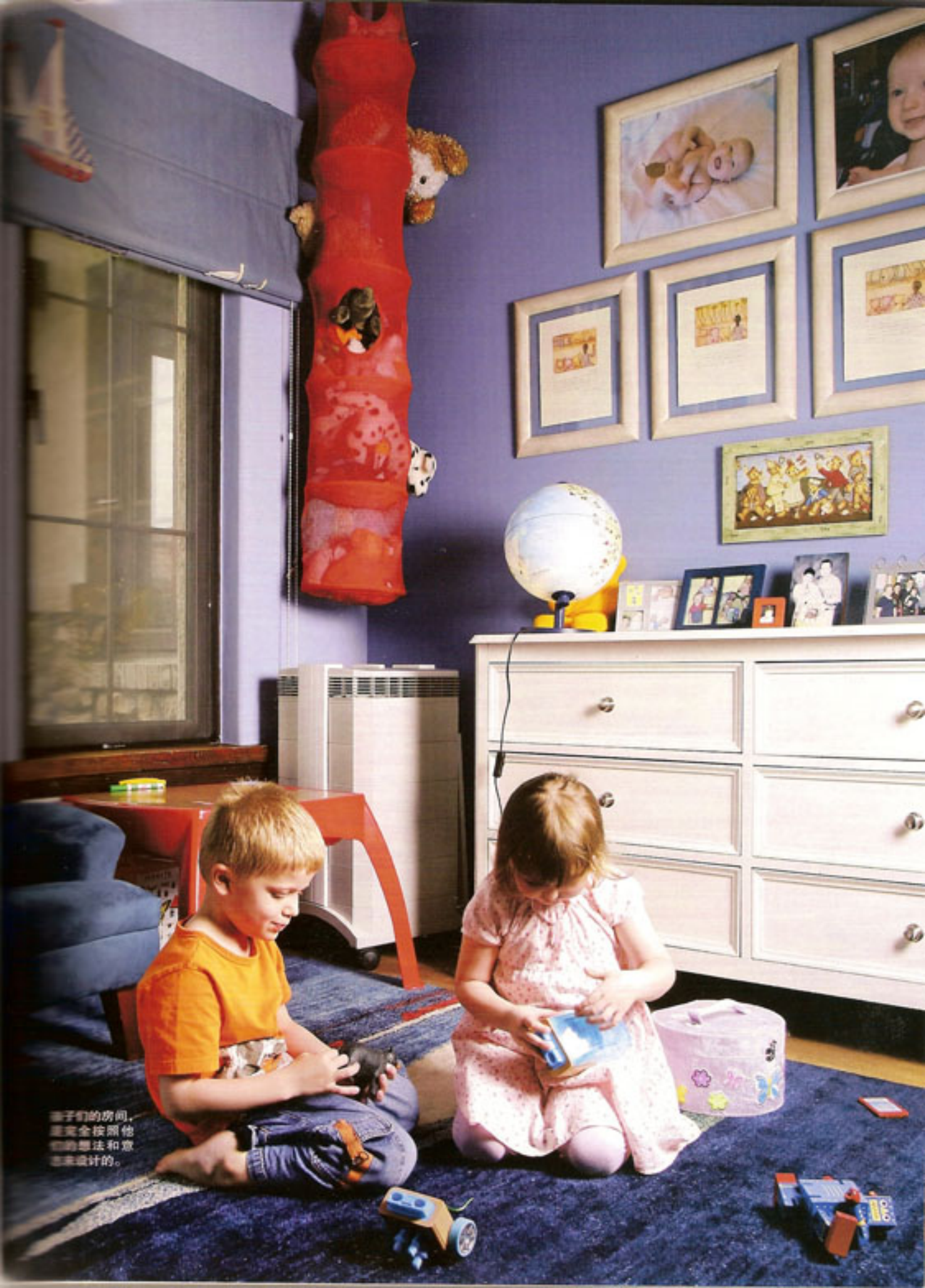
孩子们的房间， 是完全按照他 们的想法和意 志来设计的。