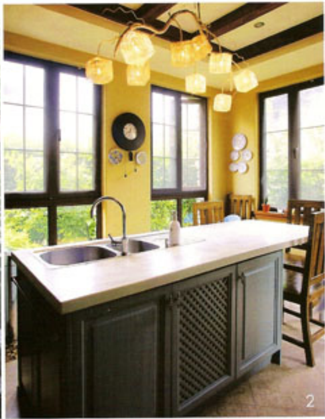
1. 户外的小径上，主人种了很多的绿色植物。 2. 对于灯具的选择主人是很谨慎的，就连厨房也不例外。

Bya来自巴西，Rick是美国人，他们一个是室内设计师，一个从事家具行业。他们在上海的家里，随处都能看到艺术以低调烫贴的方式，润滑地浸入生活。地中海式的别墅，被他们装点成时光和空间错落的博物馆，穿插着个人的成长，家庭的历史，爱情的过往。