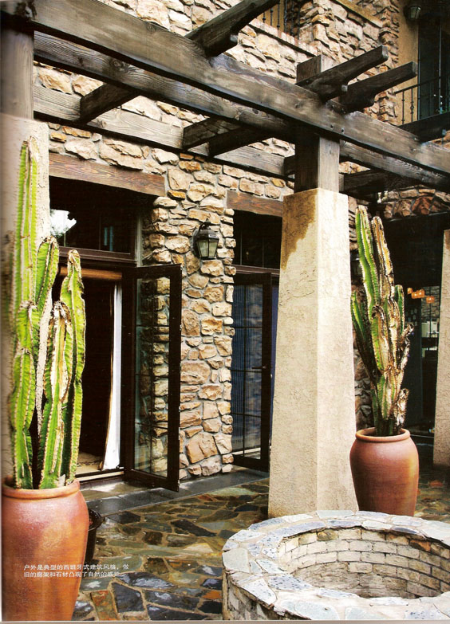
户外是典型的西班牙式建筑风格， 敦厚的廊架和石材凸现了自然的质感。